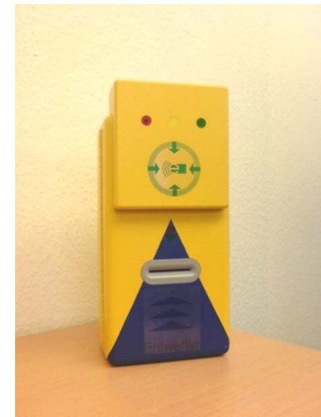
Entwerfer mit nachgerüstetem Kundenterminal