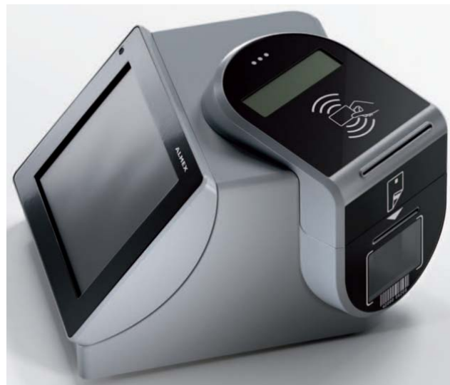
Kundenterminal integriert in Fahrausweisdrucker