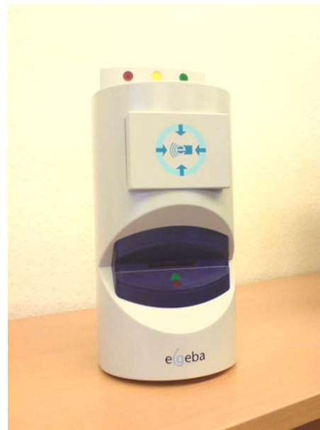
Kundenterminal Stangenmontage kombiniert mit Entwerfer